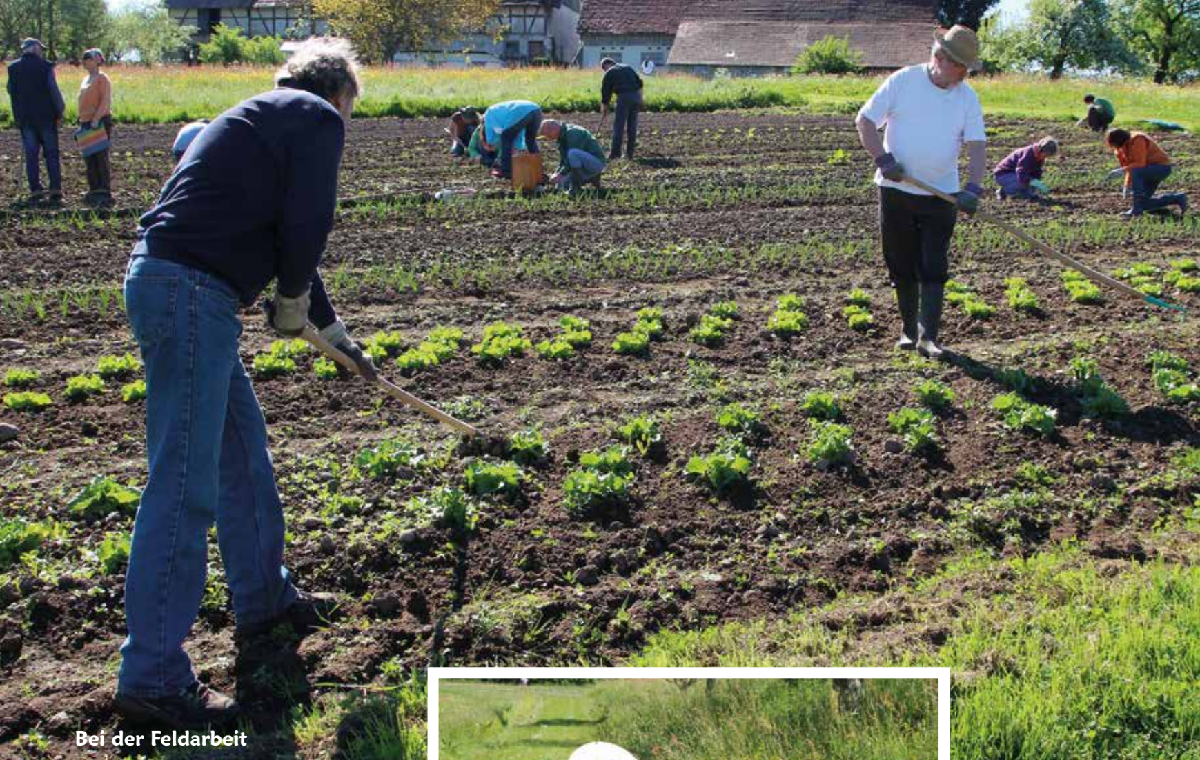
Bei der Feldarbeit

Homa-Anbau werden die Pflanzen u. a. in ihrer feinstofflichen Energiestruktur gestärkt und die Qualität des Bodens wird aufgewertet. Eine „positive“ Mikroflora und Mikrofauna entsteht. Mikroorganismen wie Bakterien, Pilze und Algen, Regenwürmer u.v.a.m. (das Edaphon) können dadurch eine reine und lockere Erde erzeugen.