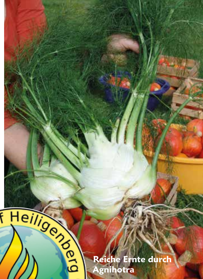
Reiche Ernte durch Agnihotra

Zum anderen wird die entstehende Asche angewendet. Für Feld und Garten reicht es normalerweise aus, die Asche auf Beeten und Feldern auszubringen. Das Asche-Pulver verteilt man sparsam von Hand über Beete bzw. Felder. Eine Handvoll reicht für etwa 30 Quadratmeter. Bei Trockenheit hat es sich als günstig erwiesen, die Asche zusammen mit Wasser an die Pflanzen zu geben. Zwiebeln, Samen und Setzlinge werden außerdem vorbereitet, indem sie mit der Homa-Asche vermischt oder