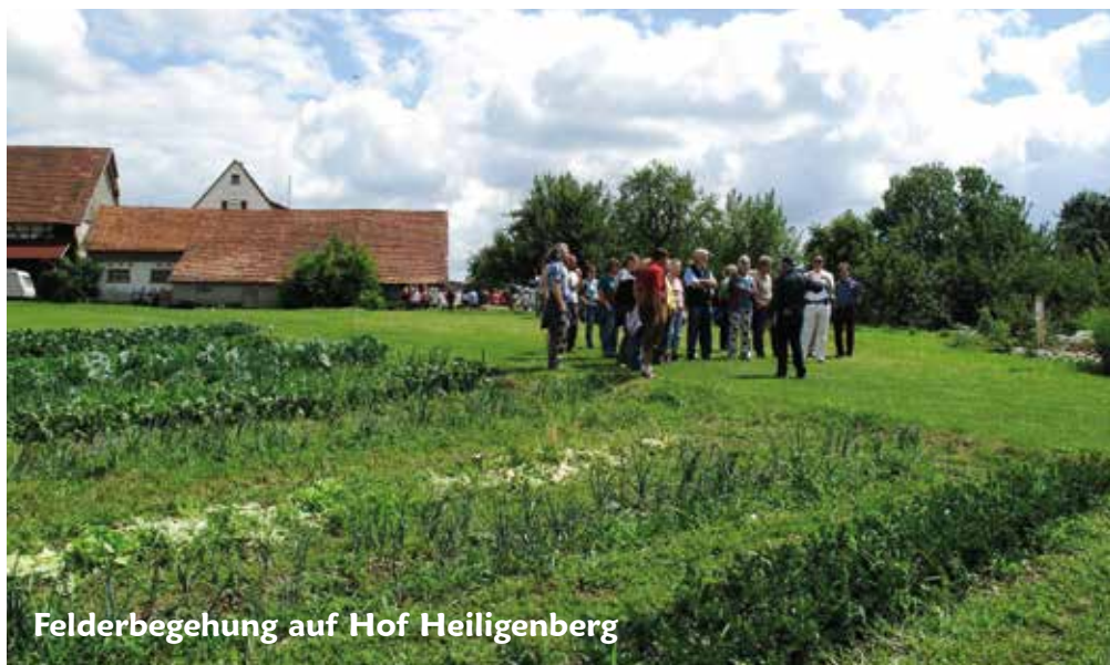
Felderbegehung auf Hof Heiligenberg

Die grundlegende und wichtigste Homa-Feuertechnik ist das Agnihotra. Es ist ein kleines Feuer, das täglich zu Sonnenauf- und Sonnenuntergang mit genau vorgegebenen Zutaten entfacht wird. Es ist leicht von jedem auszuführen, die Wirkun-