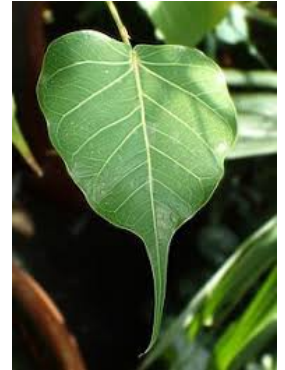
Bei uns gibt es auch einen Baum mit herzförmigen Blättern – kennst du ihn?

Nummer 2 ist der Panjan-Baum, den man an seinen vielen Luftwurzeln erkennt.